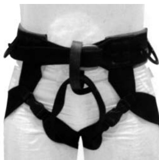
Imbracatura bassa e imbracatura completa

L'imbracatura bassa è quella utilizzata nella stragrande maggioranza dei casi. Non ci sono particolari indicazioni al riguardo, salvo ovviamente il fatto che debba anch'essa essere omologata CE, norma EN 12277. L'unico punto a suo sfavore è relativo al ribaltamento dopo una caduta. Nel caso in cui si affronti una ferrata con uno zaino, leggero o pesante che sia, e avvenga una caduta con perdita di conoscenza è possibile che il corpo del ferratista si ribalti, cosa che, ovviamente, è meglio evitare. Per questo motivo, arrampicando con lo zaino, è sempre da preferire un'imbracatura completa o combinata.