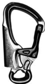
Moschettone da ferrata

I connettori (noti comunemente come moschettoni) da ferrata sono dotati di un meccanismo di chiusura automatica e presentano particolari caratteristiche tecniche. In breve sono realizzati in modo da garantire carichi a rottura superiori a quelli dei normali moschettoni ed inoltre sono più robusti per sopportare meglio il continuo sfregamento lungo la linea di sicurezza. Da normativa EN 12275 i moschettoni per ferrata sono punzonati con il simbolo "K", dal tedesco Klettersteig (via ferrata).